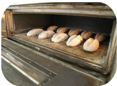
④高温に熱したオーブンへ入れる