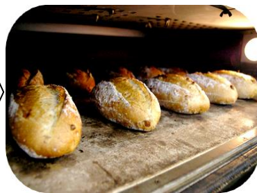
⑤オーブンへ入れて約20分で焼き上がり