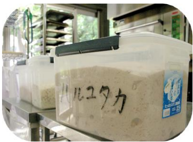
①前日から長時間かけて熟成させた生地。