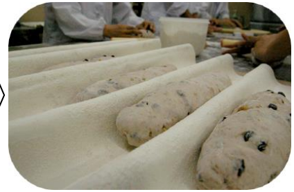
③パンの種類別に分割・成型し発酵させる。