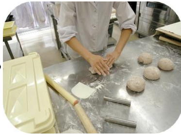
②生地を分割、休ませた後成型する。