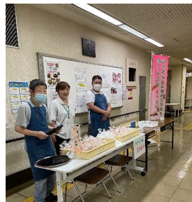
広島市心身障害者福祉センターでの出店販売の様子

この取組による契約額の実績は、令和3年度が1億1329万9千円、令和4年度が1億1077万7千円、令和5年度が1億1150万9千円となっています。実績額については、令和4年度は残念ながら前年より減少しましたが、市役所内で取組の周知に努め、令和5年度は増加に転じました。