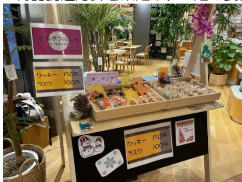
無印良品アルパーク店での出店販売の様子

の物品調達方針を策定し、一定の要件の下で、競争入札等によらず就労支援施設等から物品等を調達する取組を行っています。