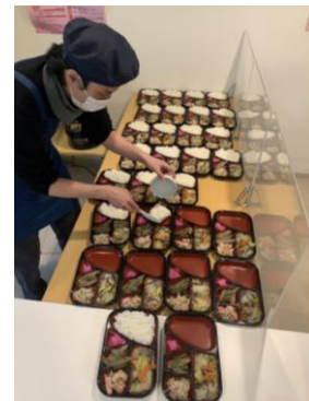
野菜たっぷり手作り弁当

事業所名 特定非営利法人 つくしんぼ作業所 電話番号 (082)220-2330 所在地 広島市東区戸坂くるめ木2-12-15